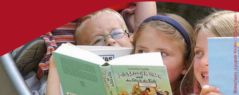
Bildnachweis: Lesende Kinder - Stiftung Lesen